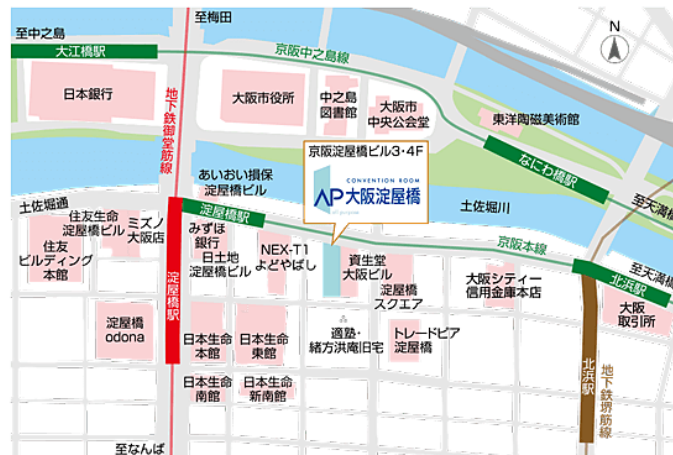
地下連絡通路ご案内図

会場住所: 〒541-0041 大阪市中央区北浜 3-2-25 京阪淀屋橋ビル 4F